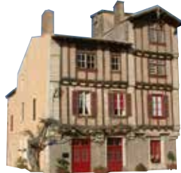
ses maisons à pans de bois

Au XV e et surtout au XVI e siècle, des industries, (tanneries et draperies) menées par de riches bourgeois connaissent un important essor. Ces bourgeois entreprenants édifient dans la rue, qui va de l'église au château, de belles demeures dont les façades, faites de jeux de briques encadrés de poutres de bois, avec des étages en encorbellement, ont gardé leur cachet.