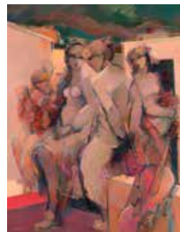
«Masque et bergamasque»