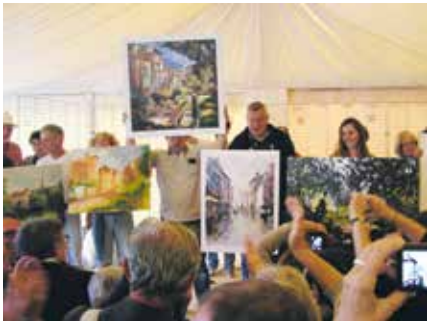
Remise des prix

Pour mieux vous accueillir, sans toutefois fixer une date limite, il serait souhaitable que les inscriptions nous parviennent avant le 15 juin.